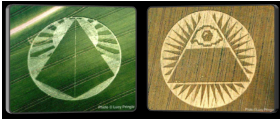
Pyramide avec soleil et pyramide avec l'œil qui voit tout