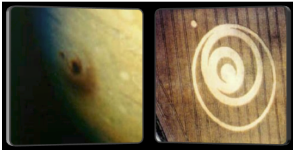
Photo de l'impact des fragments de la comète Shoemaker/Levy, sur Jupiter, du 16 au 22 juillet 1994 et agroplythe apparu à Oliver's Castle, Nr Devizes, Wiltshire, le 26 juillet 1994